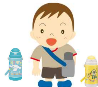
水分補給各自持参