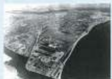
「白松園」で名高かった海岸線（昭和35年頃）