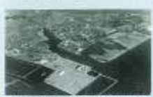
高速度鉄道の建設（昭和44年頃）

高砂の浜は、白松園松で名高い風光明媚な場所として全国に名を馳せていましたが、戦時下の埋め立てにより、浜は失われ、海辺は市民にとって遠い存在になってしまいました。あらい浜風公園は、市民からの強い要望を受け、公園に賛同する企業（神戸戸製鋼所高砂製作所と三登重工業高砂製作所）からの寄附協力を得て、海辺で憩い遊べる空間をあらたに創り出したものです。