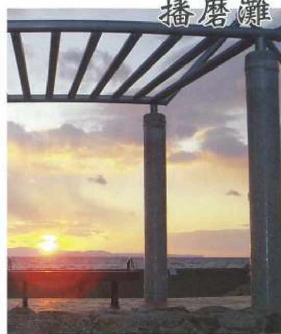
播磨灘に沈む夕陽