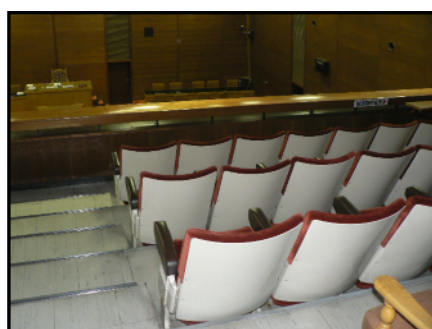
議 場 傍 聴 席