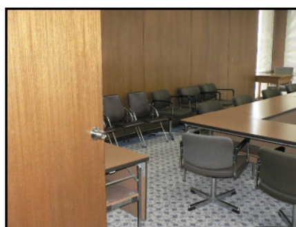
委 員 会 室